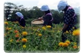
高校生のみなさんです

昨年に続き、紅花収穫祭をヴェンテングルテンにて開催いたしました。 前日の夕方からの豪雨で、ちょっと不安だった面もありましたが、当日は朝から晴天！！ 明新館高校の生徒さん達も「紺の作業着」着用で、頑張ってくれました。 塾ではお馴染みの紅花アイスを始め、紅花入りのおにぎりや、きゅうりの紅花漬けなども販売し、楽しいひと時を過ごすことができました。 詳しい様子は、ホームページにありますので、是非ご覧ください。